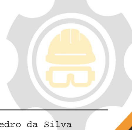
TECPORTO Treinamento e Tecnologia Ltda CNPJ nº 18.311.306/0001-24